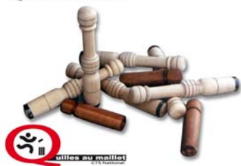
Quilles au Maillet